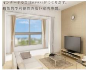
インナーテラス(室内テラス)が作りだす、機能的で利便性の高い室内空間。