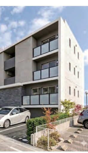
令和8年の税制改正は オーナーにとってプラス面も

これまでの相続税を減らしたい富裕層が、利回りや賃貸需要を無視して無理やりアパートを建てたり、都心のマンションを買い漁ったりするケースが多発して