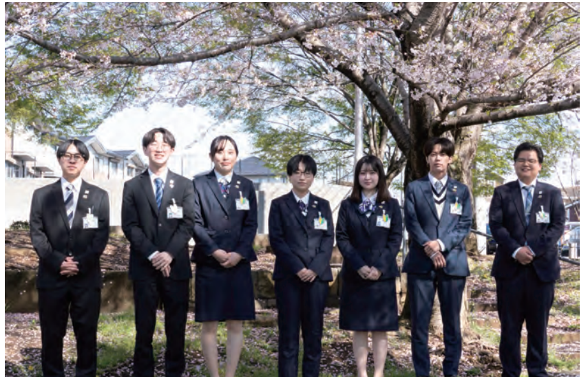
今年は散り始めでしたが桜に間に合いました

これも全て、地域の皆様からお仕事をいただけるおかげであり、皆さんも今後の仕事において、お客様お一人お一人に大切に向き合っていたいただき、地域への