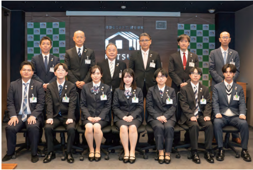
ようこそ！ 役員一同、皆さんの入社を心から歓迎します